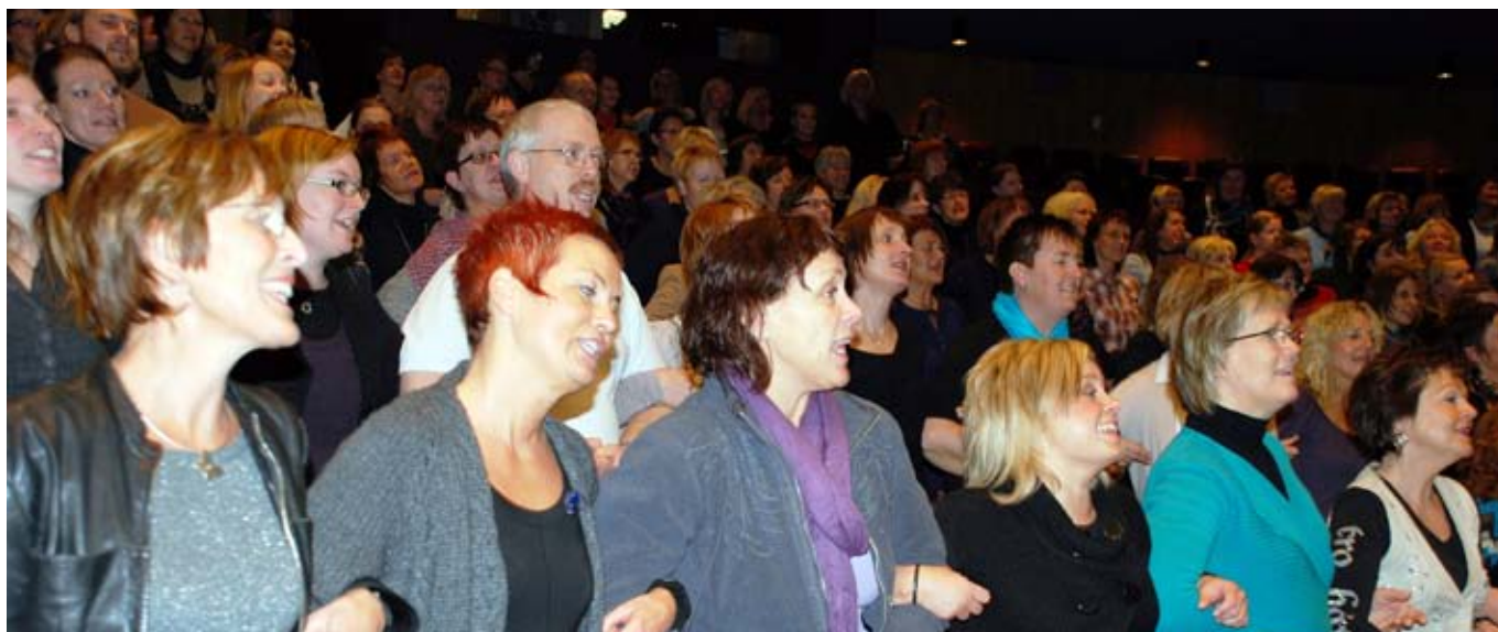
samsang og samhold: Et Kor Arti'-kurs er nyttig både som inspirasjon og lærdom samt at det er artig og nyttig å treffe andre i samme bransje.

I april 2010 blir det så Kor Arti' REP i Oslo, Bergen og Trondheim. Dette kan nytes både som en oppfriskende repetisjon eller som ny lærdom for deg som har gått glipp av tidligere kurs. I denne runden er det sanger fra utgivelsene Kor Arti' volum 7 til 12 som repeteres.