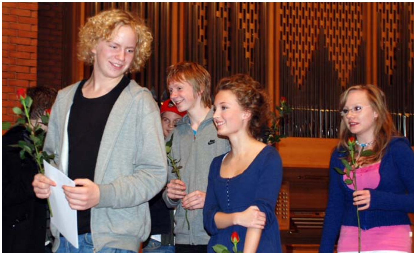
prøver seg igjen: Lerkvartetten var med i det nasjonale mesterskapet av UMM i 2008. Ensemblet er påmeldt til det regionale mesterskapet i Oslo 17. oktober.