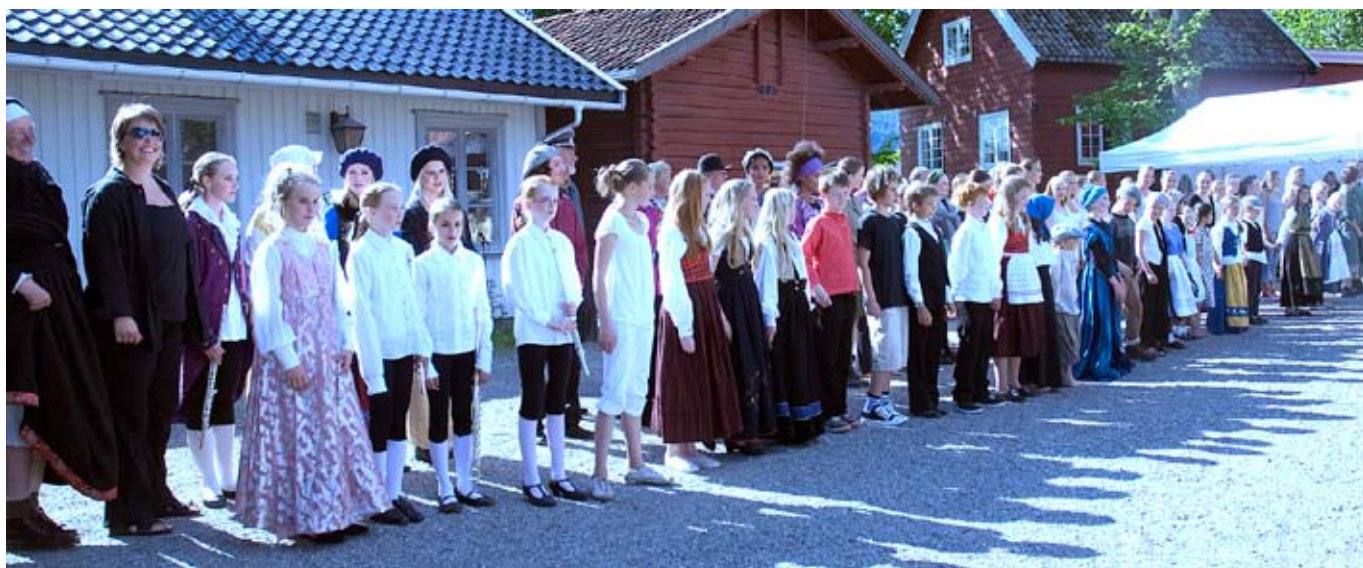
lang, lang rekke: Askerspillet involverer både lærere og elever fra kulturskolen samt gode venner fra andre lokalmiljøet..