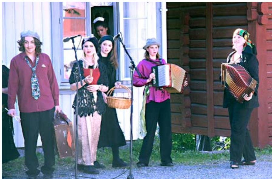
mye musikk: "Vindusflørt" består av scener fra flere hundreår. Og de innledes med tidstypisk musikk.