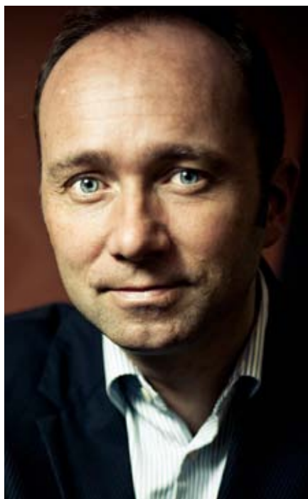
lovet kulturskolesatsing: Kulturminister Trond Giske viste gjennom Kulturløftet II stor vilje til satsing på kulturskolen.