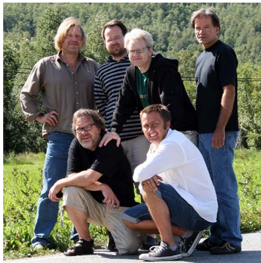
dansbare rytmer: Bayou Blue har til hensikt å få deltakerne ut på dansegolvet.